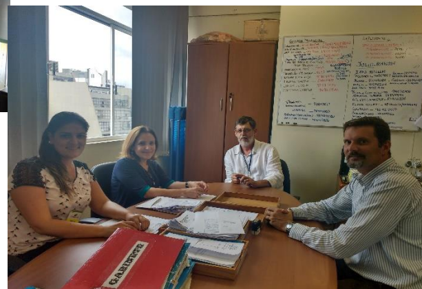
Visita ao Diretor Administrativo da SMED.