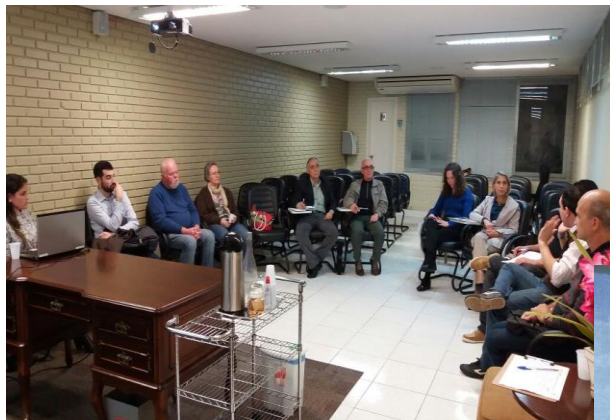
Reunião Ordinária dos Voluntários.