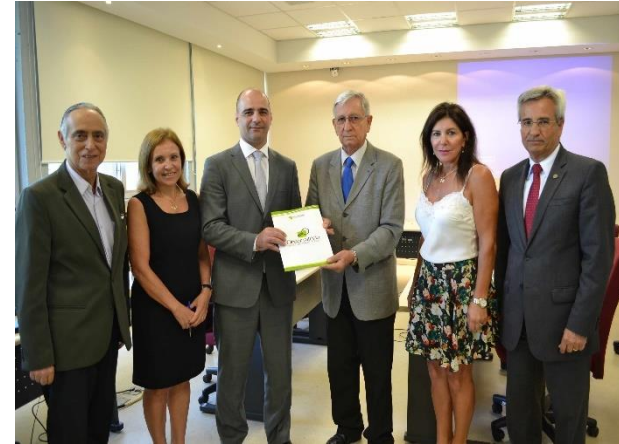
Apresentação do 2º Relatório Quadrimestral.