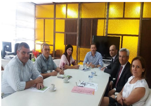
Reunião operacional na SMOV.