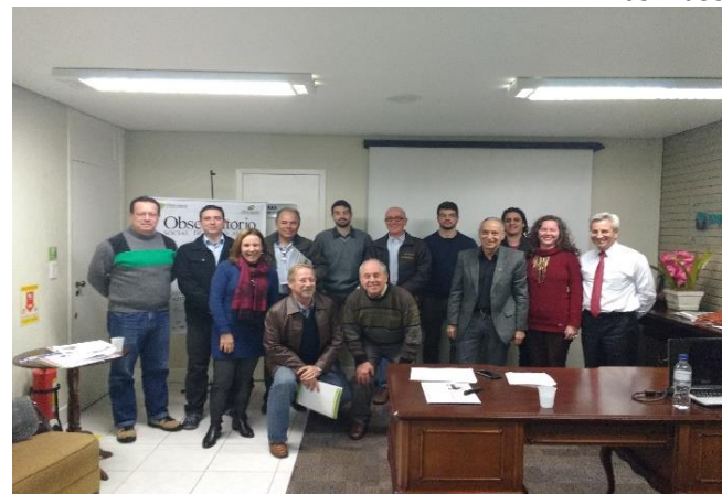
7ª Turma de Capacitação de Voluntários.