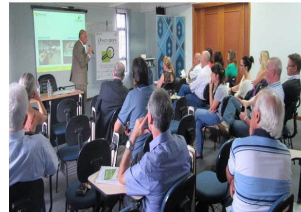
Apresentação do OSPOA no CRA/RS.