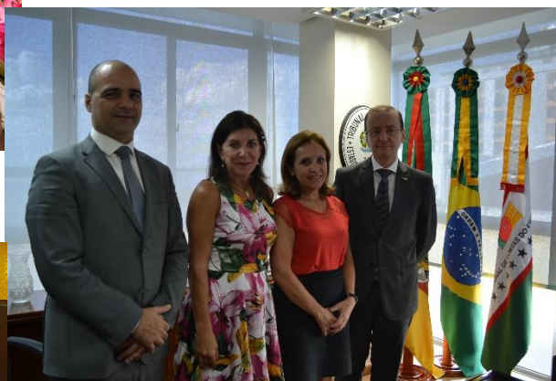
Entrega de ofício ao TCE/RS.