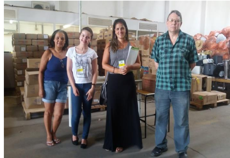
Visita ao depósito da SMED.