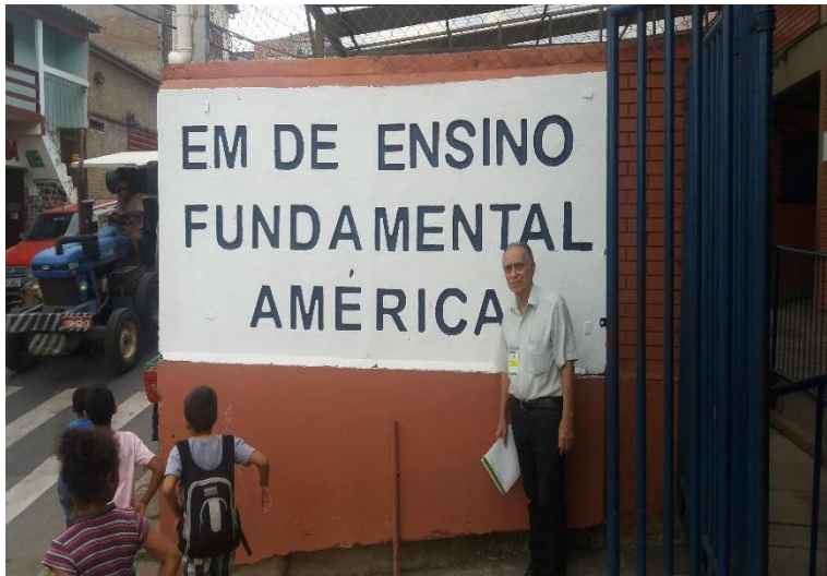
Visita a EMEF América.