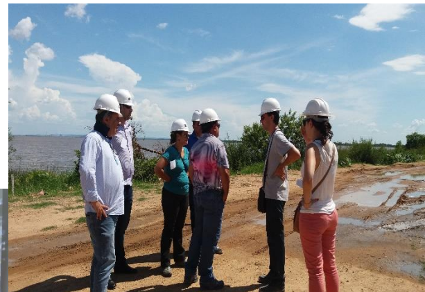
Visita a obra da revitalização da Orla do Guíba.