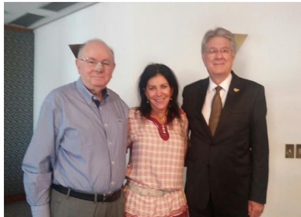
Reunião no SECOVI/RS.